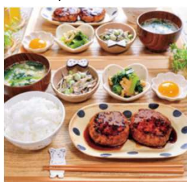
ガツンと☆激旨 絶品甘辛つくね献立