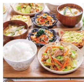
今日もごちそう☆ 肉野菜炒め献立