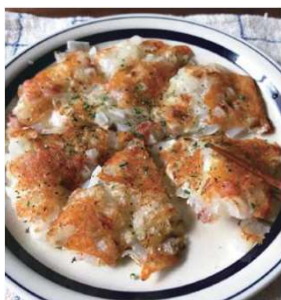
ハッシュドオニオンチーズ

レシピ本大賞の受賞を記念して、5レシピを公開します。各媒体のみなさま、ぜひご掲載ください！ 本企画は12月末までの予定です。