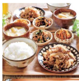
スタミナ豚炒め♪献立