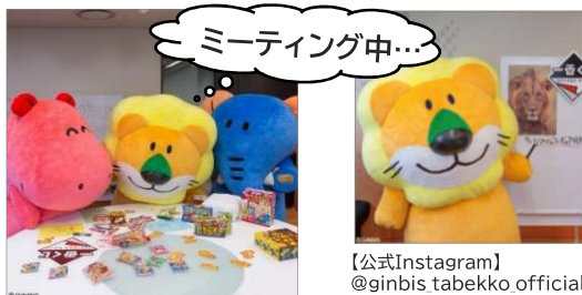
【公式Instagram】 @ginbis tabekko official

たべっ子どうぶつ公式Instagramでは、着ぐるみ化したどうぶつたちが、会議をしたり仲良く遊んだりしている姿が見られます!たくさん「可愛すぎる」「癒やされる」という声が寄せられています♪