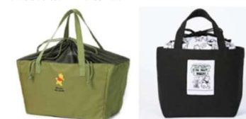
Based on the "Winnie the Pooh" works by A.A. Milne and E.H. Shepard.