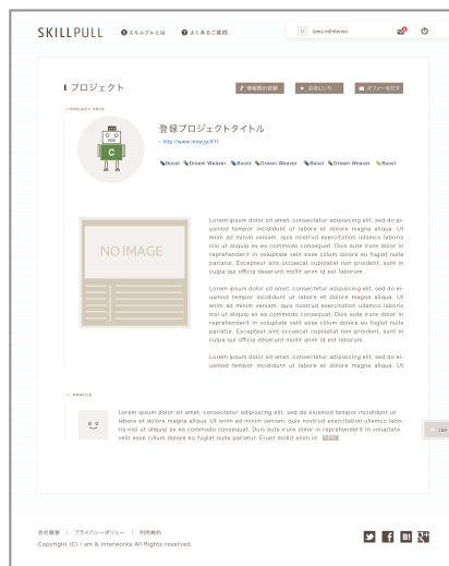
プロジェクト紹介ページ