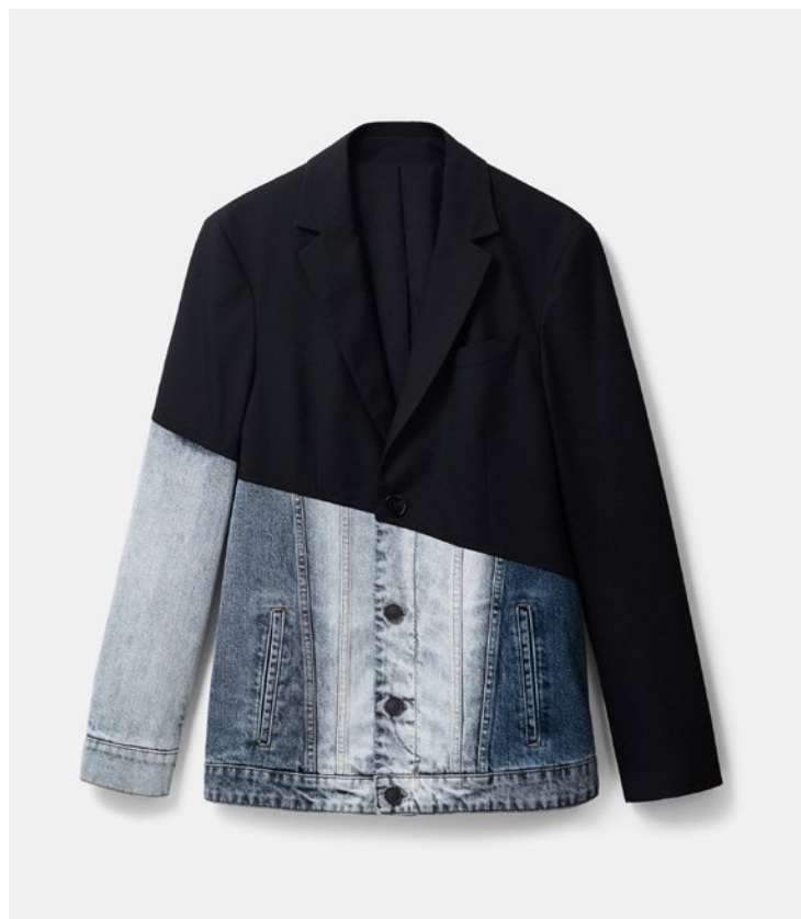
価格：レディース ¥ 31,900、メンズ ¥33,900

Desigualは1984年バルセロナで創業した国際的なファッションブランドです。個性的なデザインや特徴的なアイテムの数々でその名を知られています。“最高の自分を表現したい”と願う世界中の人々に自分の個性を生かすポジティブさをもたらすことを目的としています。現在、3,700人の従業員を擁し、プロダクトはレディース、メンズ、キッズ、アクセサリ、シューズ、スポーツといった6つの商品カテゴリーを世界92か国、10の販売チャネル、500以上のブランドショップを通じて展開をしています。