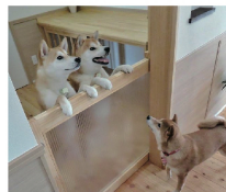
総合建設西沢商会 施工事例