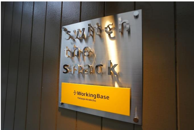
「switch the snack」及び「Working Base Yotsuya-Arakicho」の看板