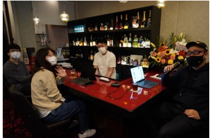
カラオケ用マイクを持ち、カラオケ画面にウェブ会議システムを投影し会議をする様子

当社ではサテライトオフィスを、働く場所＝「Working Base（ワーキングベース）」と呼んでおり、2020年5月に全社テレワーク化を宣言、社内プロジェクトとして「Working Base Project（ワーキングベースプロジェクト）」を発足しました。働く場所や時間など、従来の働き方についての変革と再構築を行う、「検証」を目的として取り組んでいます。