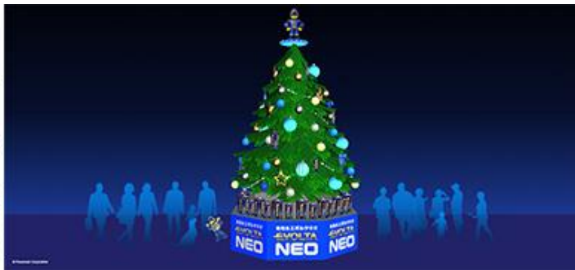
(左・リアルイベント会場イメージ 右・スペシャルWEBコンテンツイメージ)

リアルイベントでは、MIYASHITA PARK South 2F 吹き抜け広場に6メートルの巨大なエボルタ NEO チャレンジツリーを設置し、乾電池エボルタ NEO の長もち性能を実証するために、乾電池エボルタ NEO (単1形) 500本を動力に、LED電飾10,000個の約1ヶ月間連続点灯に挑戦します。会場では参加者が「今年チャレンジしたこと」を声でツリーに届けると、エボルタ NEO くんからのメッセージが届くイベントも実施 (期間：2022年11月24日(木) 13:00～12月26日(月) 16:00 ※予定)