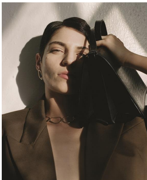
BAG ¥79,200(tax in)