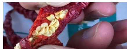
▲伏見甘長唐辛子のタネ 京野菜の1つで、江戸時代の書物にも 登場する歴史ある野菜。 食べる時の色は緑色の状態。