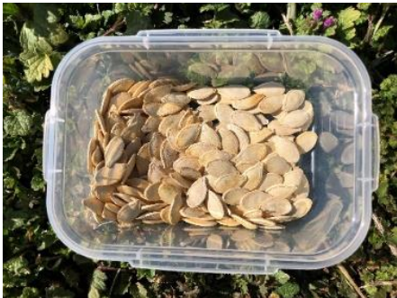
▲東京南瓜のタネ 西洋カボチャの元祖。 甘くほくほくしており、 煮物や天ぷらに最適です。

また、現状の日本の農業では、種（F1種）は、海外輸入に頼らないと持続できない状況です。そのため、種を採ることも循環型農業の1つです。当社では、環境維持、種の維持を含めて責任を持つことから自家採種を急ピッチで進めています。