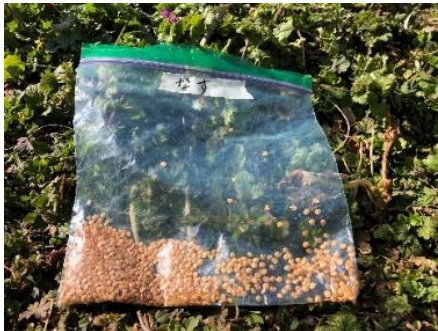
▲早生真黒茄子のタネ 皮がやわらかく、表面は黒に近い紫色を しています。昨年人気No.1野菜です。