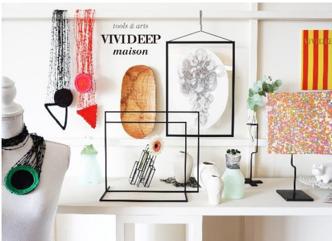
VIVIDEEP maison 暮らしの道具とアート小売り