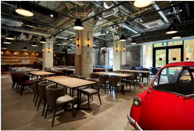
numero five イタリアンレストラン