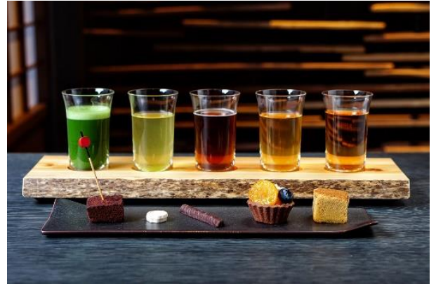
祇園北川半兵衛 なんば店 日本茶のカフェ