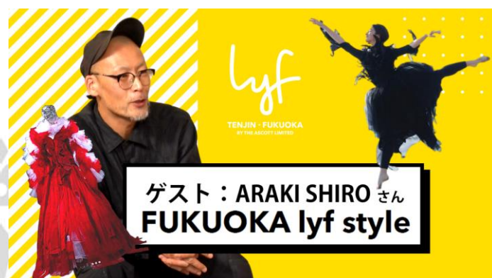
FUKUOKA lyf style ARAKI SHIRO サムネイル