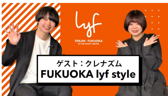
FUKUOKA lyf style クレナズム サムネイル