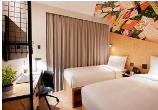
サイドバイサイドプラス (スタジオコーナーツイン/16㎡)