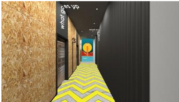
3階エレベーターロビー