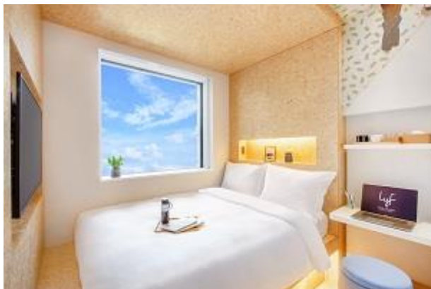
ワンオブアカインド (スタジオダブル/12㎡)

ワン オブ ア カインド (スタジオダブル/12㎡)、サイド バイ サイド (スタジオツイン/12㎡)、サイド バイ サイド プラス (スタジオコーナーツイン/16㎡)、ワン オブ ア カインド プラス (ユニバーサル/22㎡)