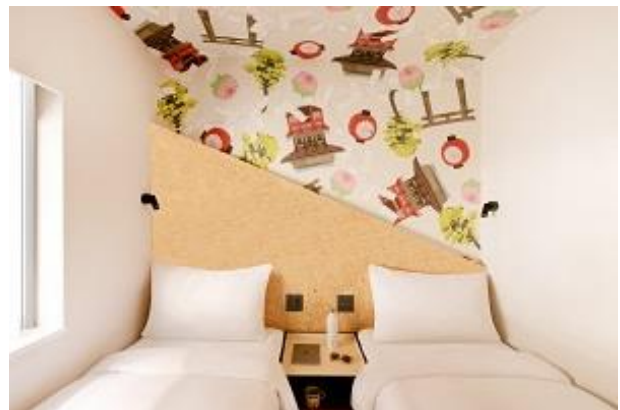
サイドバイサイド (スタジオツイン/12㎡)