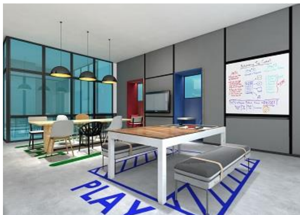
Connect (コワーキング/ラウンジ)

Connect (コワーキング/ラウンジ)、Bond (ソーシャルキッチン)、Wash & Hang (コインランドリー)、Refuel (カフェバー)、喫煙室