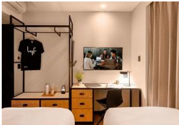
サイドバイサイドプラス (スタジオコーナーツイン/16㎡)