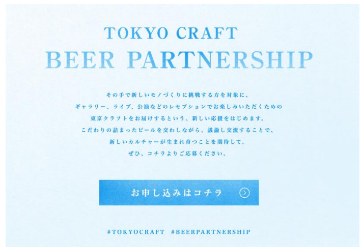
応募サイトイメージ