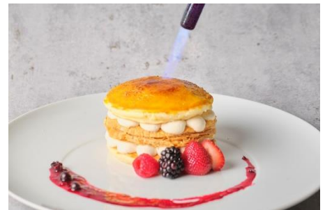
かぼちゃクリームをキャラメリゼ