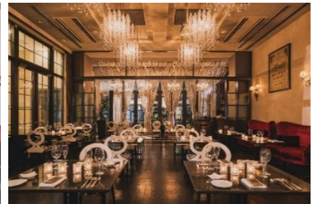
レストラン内観 夜