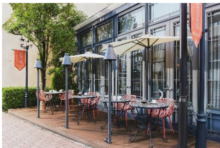
愛犬同伴も可能なマンジャーレテラス