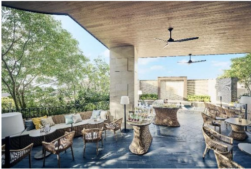
ラナイテラス席イメージ

特別フロア「ラナイテラス&ラウンジ」は伊勢山ヒルズの4階に位置し、風と水を感じる開放的なテラス席からは、まるでお城のような外観の大聖堂を望むことができるほか、海をモチーフとしたバーが特徴的な室内のラウンジ席を備える、ハワイアン・ラグジュアリーな空間です。毎月、特定日限定で開放し、季節のアフタヌーンティーやパフェ、パンケーキ、ハンバーガーなどをご堪能いただけます。