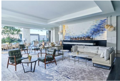
ラナイラウンジ席イメージ