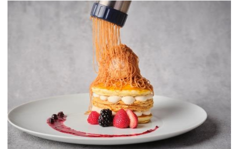
モンブランクリームを絞りたてでご提供

一口の中で様々な食感を味わえる、“ハイブリッド”なパンケーキを新発売いたします。