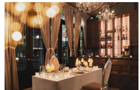
レストラン店内 半個室