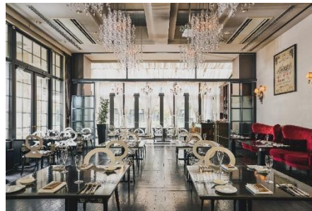
レストラン内観 昼