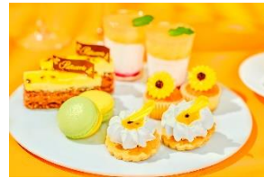
スタンド1段目(スイーツ)