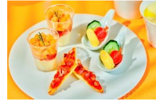
『トロピカル・サマー・アフタヌーンティー～HIMAWARI～』(2名分)イメージ

シーズン毎にテーマを設定し、専属パティシエが手掛ける繊細で華やかなスイーツをご堪能いただける人気のアフタヌーンティー。サマーシーズンは、マンゴーやパイン、ピーチ、ライムなど、ビタミン・ミネラル豊富なサマーフルーツをふんだんに使用し、暑い夏にもさっぱりとお召し上がりいただけるスイーツをご用意しました。