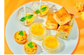
スタンド2段目(スイーツ)