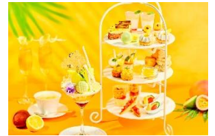
パフェとのセットも販売