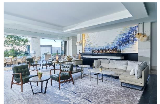
▲(写真左上より時計回り)アフタヌーンティー2名分イメージ、大聖堂を臨むテラスでのアフタヌーンティーイメージ、ラナイテラス内観

◇感染症に関する当社の取り組みはこちら◇ https://www.bestbridal.co.jp/images/top/hygiene_ho.pdf