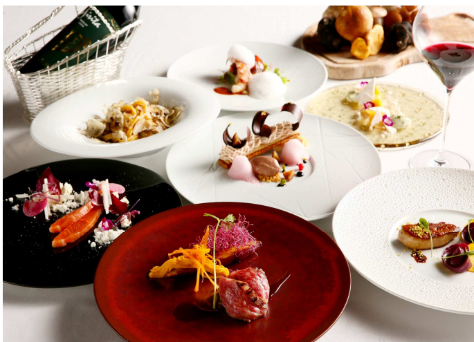
「The Delicacies」ディナーコースイメージ

「ヘルシー」「ビューティー」「フレッシュ」のコンセプトのもと、新鮮な野菜やオリーブオイルをたっぷり使って優しい味に仕上げたニューヨークスタイルのヘルシーイタリアンダイニング。秋の味覚のキノコやお野菜、果物をふんだんに使用し、オマール海老やフォアグラ、和牛サーロインなどの高級食材のメニューもセレクトワインとともに楽しみいただけます。時間帯ごとに表情が変わるスタイリッシュな店内で提供する秋のヘルシーイタリアンは、フルコース“プリフィックススタイル”や“ライブメランジェサラダ・オードブル・スープ プuffe&プリフィックスコース”など、多彩なスタイルでランチ・ディナーともにご用意。また、ラウンジBarスペースでは、アンティパストとお酒をお楽しみいただけ、大人のご褒美パフェも販売いたします。