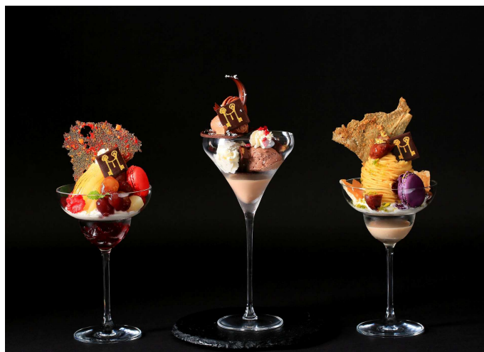
「大人のご褒美パフェ」Autumn Style イメージ