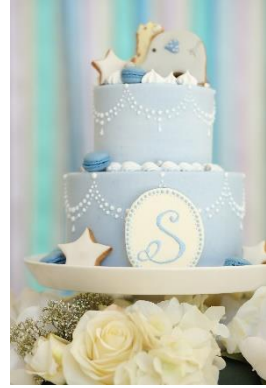
▲ケーキイメージ画像