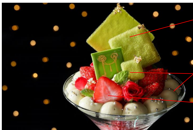
▲パフェ上段 イメージ

“シメパフェ”とは、北海道札幌市で広がる夜のブーム「お食事の後に食べる締めのパフェ」のこと。甘いパフェでお食事を締めくくるのは至福の瞬間。コース料理のデザートを大人のご褒美パフェに変更することが可能（+800円）なので、“シメパフェ”としてもおすすめです。自分へのご褒美として、大切な方の記念日に、ちょっと大人な優雅なひとときを存分にお楽しみください。