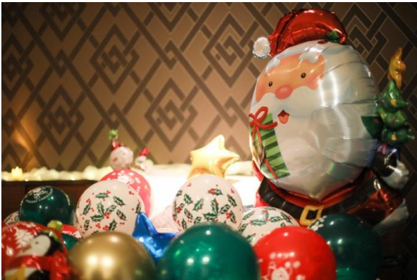
▲見ただけでHAPPYな気分！ クリスマス仕様のデコレーションルーム