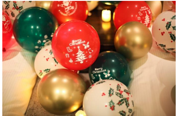
▲“思わず写真を撮ってしまう！”たくさんのバルーンでお部屋を装飾