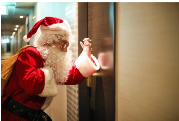
▲12月21日 & 24日限定！ サンタクロースがお菓子と特別アメニティをお部屋にお届け