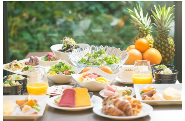
▲「ヘルシー・ビューティー・フレッシュ」がコンセプトのフルブッフスタイル朝食