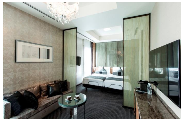
▲スイートルーム イメージ