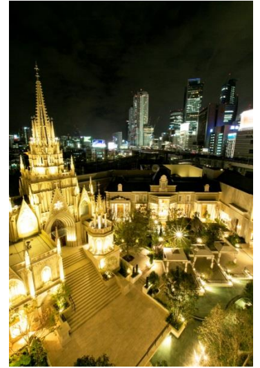
▲“チャペルビューールーム”はデラックスツインルーム限定