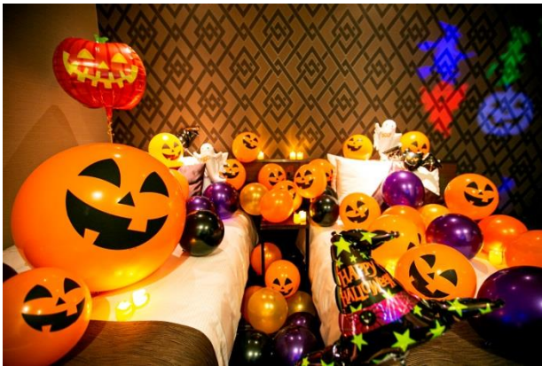
▲見ているだけでHAPPYな気分！ハロウィン仕様のデコレーションルーム