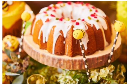
▲デザートbuffet イメージ

『夢見るハニーハント デザートbuffet』は、ウェディングパーティシエが作る、はちみつを贅沢に使った特製スイーツをbuffetスタイルでご堪能いただける日程限定の特別イベント。デザートbuffetの主演は、美容にも効果があると言われている「はちみつ」。フォトジェニックな装飾が並んだデザートbuffetには、はちみつを使ったデザートピザや、くまさんのカキ氷、ミツバチのカップケーキなど思わず写真を撮りたくなるかわいらしいスイーツをご用意しています。また、お食事メニューも充実しているので、ランチを兼ねて楽しんでいただけるbuffetイベントです。