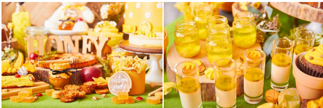
▲写真は全てイメージです

■アクセス：地下鉄各線本町駅22番出口より徒歩4分/心斎橋駅より徒歩8分/四ツ橋駅1・A出口より徒歩4分