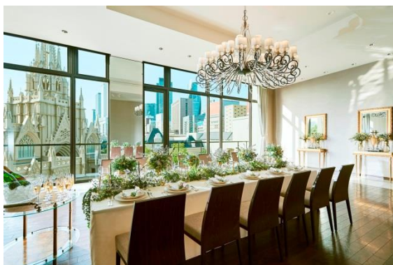
▲雨天の場合はバンケットにて開催(左画像:「ルーフトップガーデン」、右画像:「スカイビューールーム」)