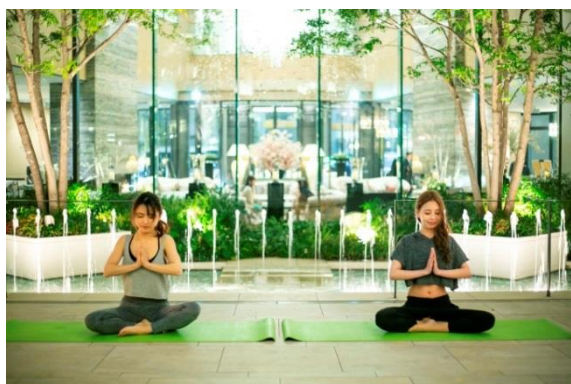
▲夜の中庭はまるでリゾートにいるかのような空間

■詳細URL： https://www.strings-hotel.jp/nagoya/recommend/party/banquet/5474.html