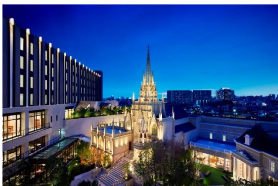
▲思わず写真を撮りたくなる“写真映え”する夜景