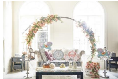
フォトスポットイメージ

https://www.bestbridal.co.jp/restaurant/event_base/cinderella_aoyama/