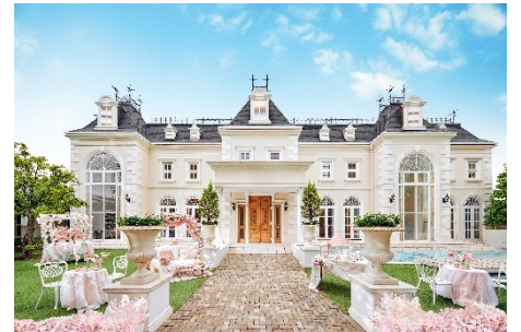
▲(写真左上より時計回り)buffetイメージ、デザートイメージ、食事会場となる披露宴会場「シャトー・シャンパーニュ」邸 外観