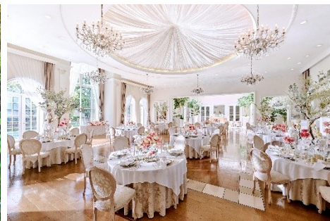
▲披露宴会場(シャトー・シャンパーニュ邸)

◇◆ 本件に関する報道関係者からのお問合せ先 ◇◆ 株式会社ツカダ・グローバルホールディング ベストブライダル広報担当:吉永・千葉 〒105-0022東京都港区海岸1-16-1 ニューピア竹芝サウスタワー12階 TEL/03-5464-0108 E-mail/bb-pr@bestbridal.co.jp