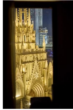
▲デラックスツイン/レジデンスツイン限定 チャペルビュールームからの眺め

https://www.strings-group.jp/nagoya/restaurant/chefslive/breakfast/