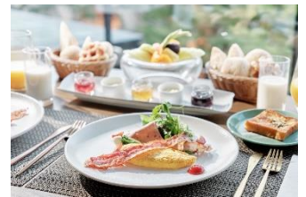
▲和洋食に加え、きしめんや名古屋コーチンの卵を使用したフレンチトーストなど、名古屋グルメも楽しめる朝食 2階「シェフズライブキッチン」：7:00～10:00(L.O. 9:30)

※ストリングスホテル 名古屋では、お部屋ごとに異なるマットレスを採用しております。本プランでお選びいただける「デラックスツイン/レジデンスツイン/スイート」ルームには、シーリー社と共同開発した当ホテルオリジナルの「Black Label by The Strings Hotel」を導入。マイナスイオンを生成し快適な睡眠を体験いただけます。