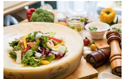
【写真左より時計回り】ビアガーデンイメージ、ドリンクイメージ、シェフが目の前でスライスするラスパドゥーラチーズ

赤坂アプローズスクエア迎賓館で昨年開催し、人気を博した『“ギルトフリー”夏を愉しむビアガーデン』。低カロリー・高タンパクの食材を使用し、コース仕立てで仕上げた彩り豊かな夏らしいスパイシー料理と、ビールやカクテルなどのフリーフローを、結婚式場の快適でおしゃれな空間でゆったりとご堪能いただける期間限定“ご褒美ビアガーデン”を、今年も開催いたします。