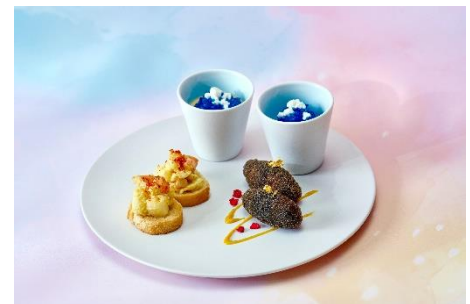
▲スイーツ イメージ①/スイーツ イメージ②/セイボリー イメージ