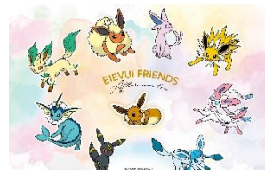
▲メニュー表/ランチョンマット イメージ