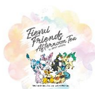
▲コースター イメージ