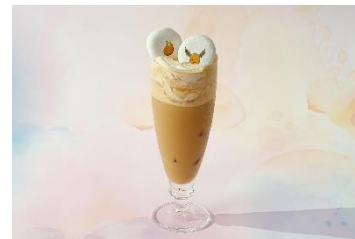
▲全店舗で提供 オリジナルドリンク