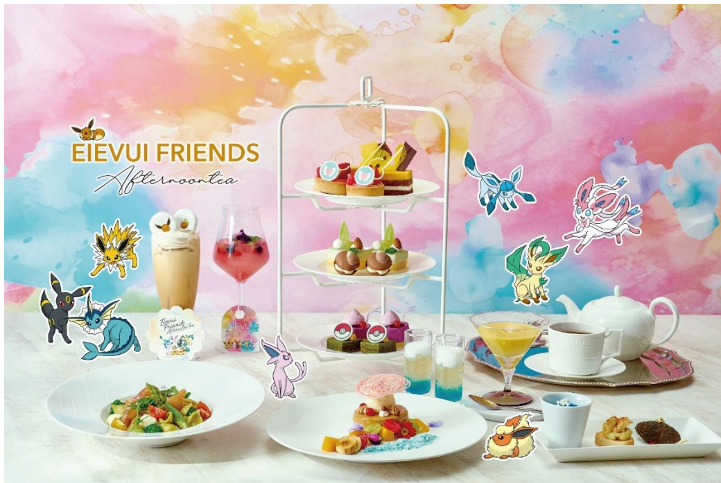
▲アフタヌーンティー(スペシャルティ・ランチ・オリジナルドリンクあり) イメージ

日本国内外問わず、世界中から愛される「ポケモン」。2023年は“ピカチュウ”をモチーフにしたアフタヌーンティーを「ストリングスホテル 名古屋(所在地:愛知県名古屋市中村区平池町4-60-7)」と「ザストリングス 表参道(所在地:東京都港区北青山3-6-8)」にて期間限定開催いたしました。