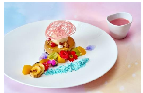
▲アフタヌーンティー イメージ(スペシャルティ・ランチ・オリジナルドリンクあり)/アフタヌーンティー イメージ/スペシャルティ イメージ