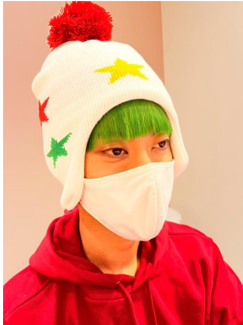
ニット帽被ってみました