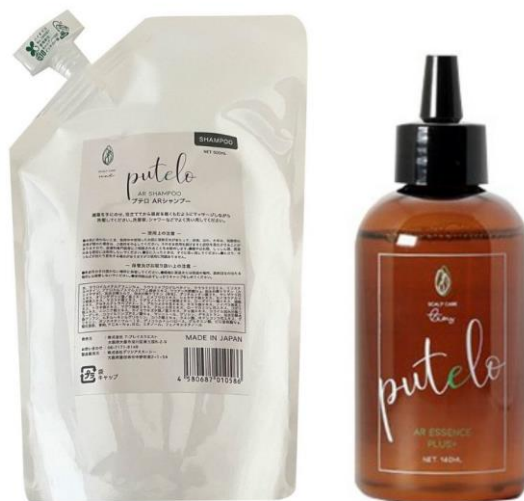
オリジナル商品販売中