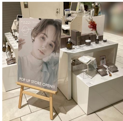
渋谷ヒカリエ ShinQsのポップアップストア（2022年12月開催）の様子

https://www.tokyu-dept.co.jp/shinqs/access/index.html