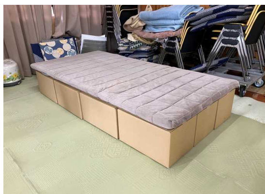
(段ボールベッドをご使用されている様子)

当社グループは、今後も被災の状況に応じて、さらなる支援を実施していきます。 被災地の一日も早い復旧・復興を心よりお祈り申し上げます。