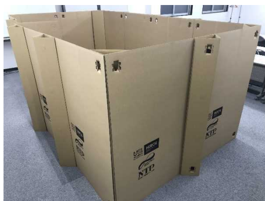
(段ボールパーテーション)