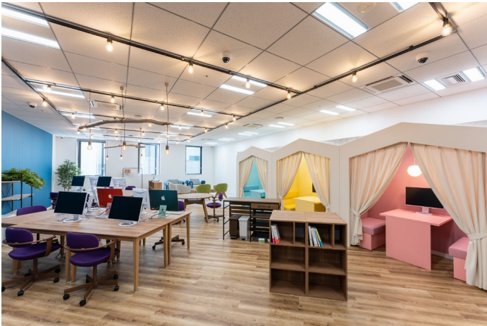
(デジタルハリウッド STUDIO 三宮)

https://school.dhw.co.jp/school/sannomiya/