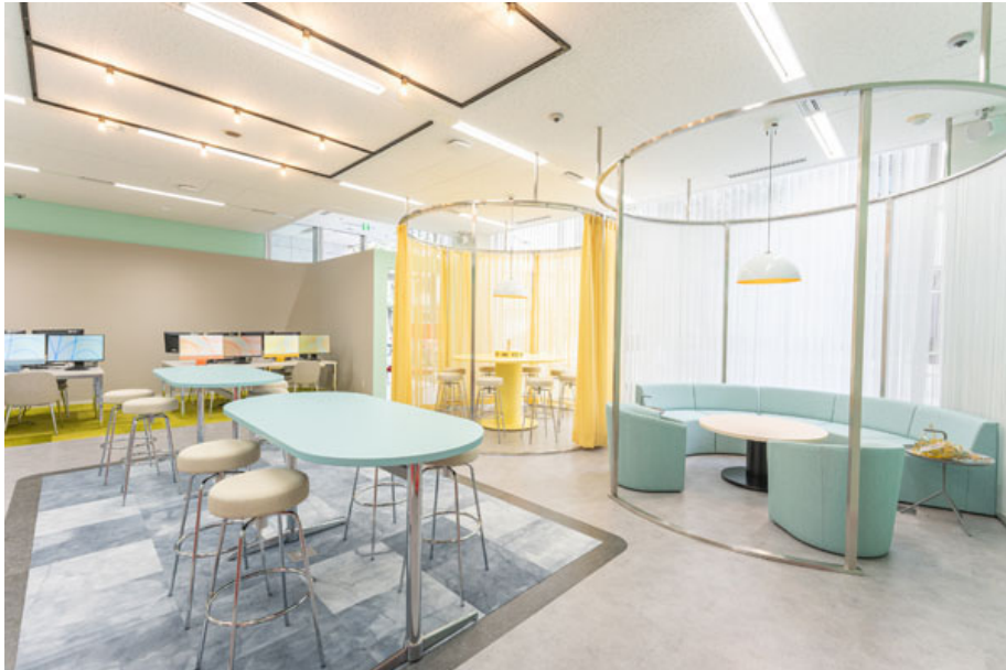
デジタルハリウッド STUDIO 立川

また今回映像編集の学習を行う校舎となります、デジタルハリウッド STUDIO 立川にて開講記念コース説明会を2023年10月20日(金)に行います。実際の空撮映像などをご覧頂きながらコース内容をイメージして頂く会となっておりますので、ご興味お持ち頂けましたらぜひご参加ください。