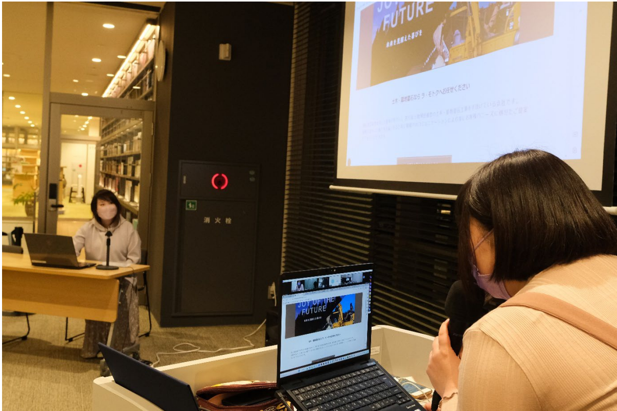
(修了発表会での講師フィードバック)