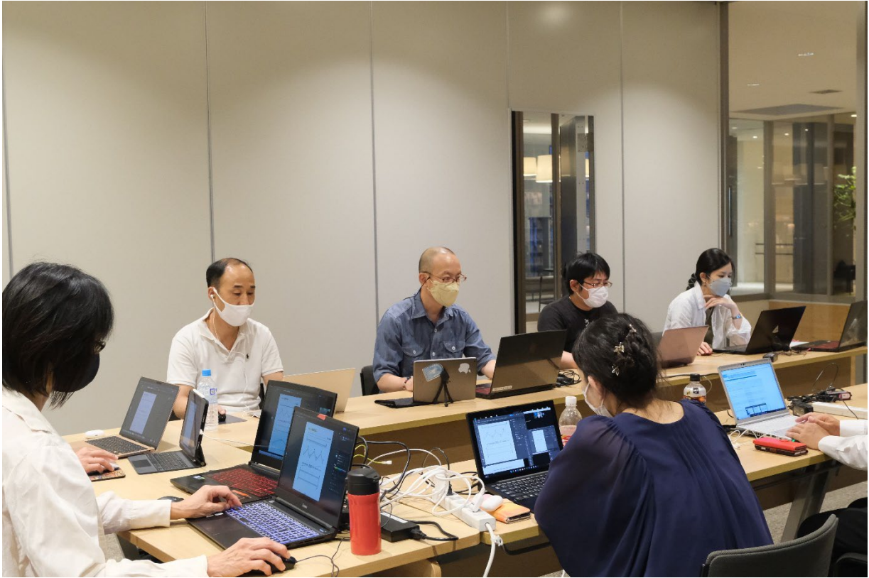
(高梁市図書館に集まり Zoom でライブ授業を受講)