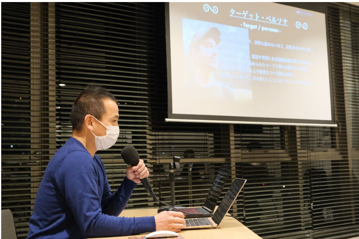
(修了発表会での受講生発表)