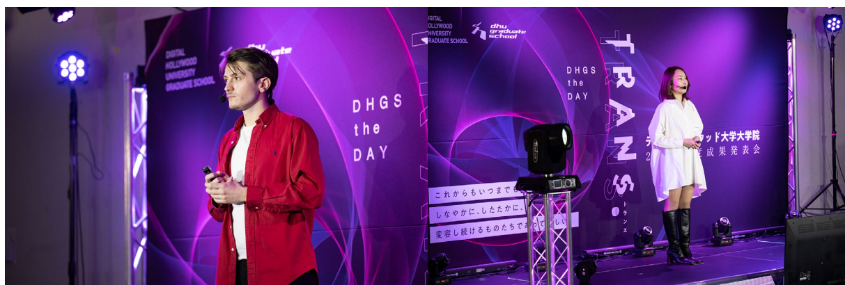
〈TRANS. DHGS the DAYの様子〉

https://gs.dhw.ac.jp/students/exhibition/