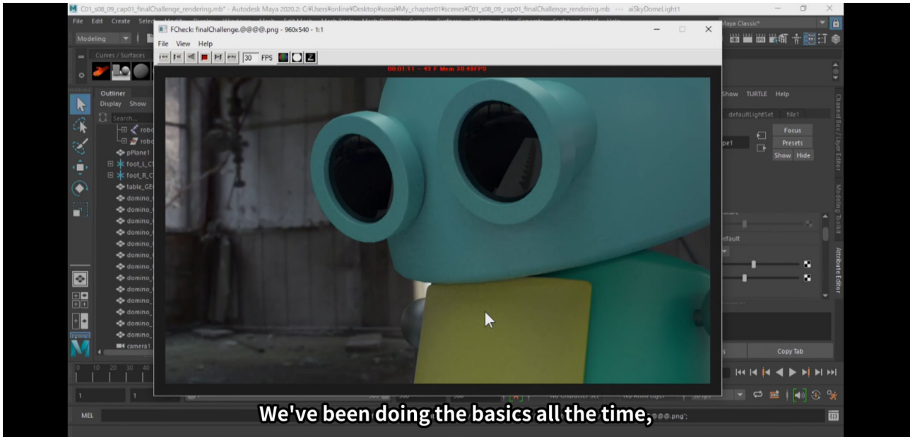
(動画教材のワンシーン)