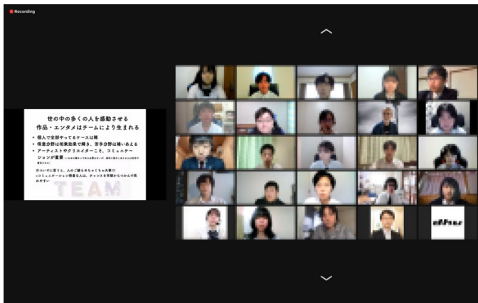
▲デジタルコンテンツに関する講義