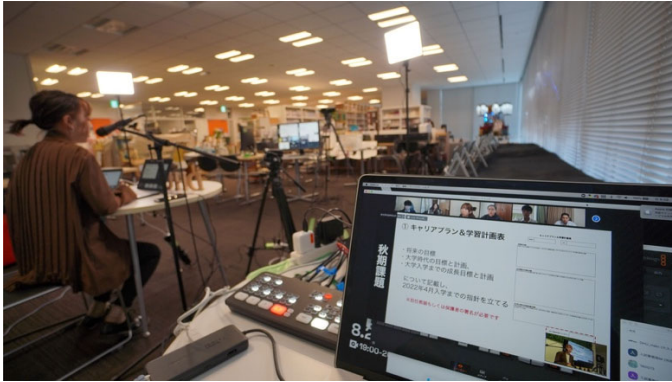
▲オータム・トライアウト(二次選抜)当日の様子