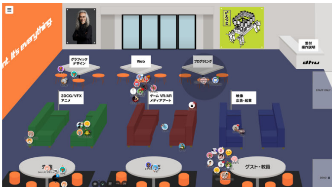
▲オンライン交流会