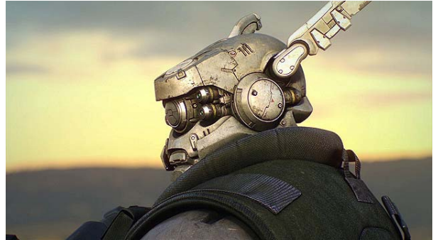
Motion picture (C) 2014 Lucent Pictures Entertainment Inc./ Sony Pictures Worldwide Acquisitions Inc., All Rights RESERVED. Comic book (C) 2014 Shirow Masamune/Crossroad

世界大戦後の荒廃したニューヨークで戦火を生き抜いた元 SWAT の敏腕女性隊員デュナンと、その相棒・サイボーグとなったかつての恋人ブリアレオスは未だ戦いの日々を送っていた。終わりの見えない戦いの中、人類が生み出した理想都市オリュンポスでの安息を夢見る二人の前に突如現れた1人の少女。オリュンポスから来たという彼女は謎の追手に追われていた。少女と行動を共にする中で、二人は彼女の身体に秘められた秘密を知ることになる。それは世界を、地球を破壊し尽くすほどの巨大な力の鍵だった。迫り来る更なる最強の追手、今、人類の未来は二人に託された。