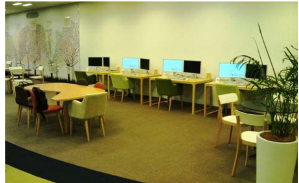
<デジタルハリウッド STUDIO NEC ネットズエスアイ 施設内>

当社は、企業のニーズに合わせた教育を提供する「講師派遣型研修」や、当社の施設を活用した「集合型研修」など様々な教育ソリューションを行っております。