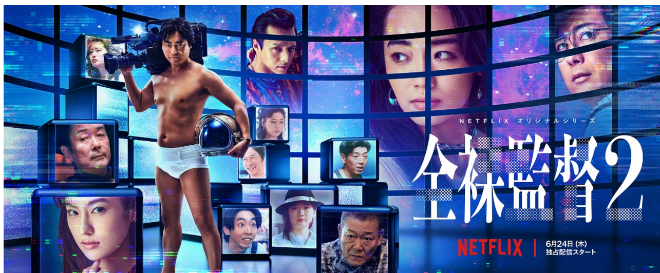
(Netflix オリジナルシリーズ「全裸監督 シーズン2」全世界独占配信中)

※「コンポジター」とは、3D や 2D の原画、実写映像など、1つの作品としてそれぞれのデータを組み合わせ合成(コンポジット)し、最終的な画を制作するお仕事です。