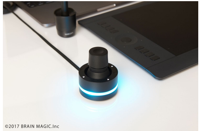
©2017 BRAIN MAGIC, Inc.