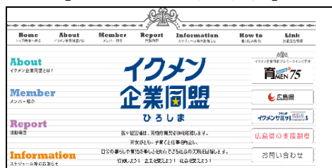
【ホームページトップ画面】