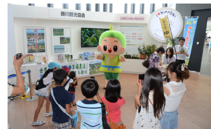
<キャラクターとのふれあいイメージ>

●ももっち(岡山県) ●ちよる(山口県) ●ふでりん(広島県) ●すだちくん(徳島県) ●親切な青鬼くん(香川県) ●みきゃん(愛媛県)