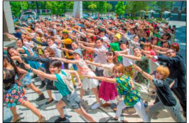
《CM動画の一場面 撮影には多数の若者が参加》

ご多忙のことと存じますが、ご取材や貴メディアでのご紹介を賜りますようお願い申し上げます。