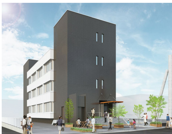
施工前のNTT溝ノロビル（左）とBOILの外観イメージパース（右）