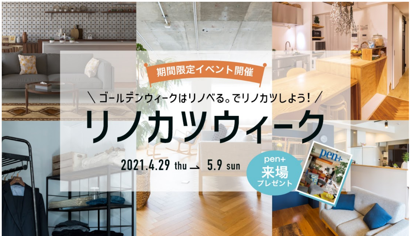
リノカツウィーク メインビジュアル

「リノベーション活動」、略して「リノカツ」は、中古マンション購入+リノベーションを知り、学び、体験する活動について名付けたものです。今年のGWは、中古マンション購入+リノベーションをいちから学べるイベントとして、4月19日にプレスリリースを配信したTBS金曜ドラマ『リコカツ』とのコラボセミナーや、ショールームの見学会など、様々な角度からリノベーションを知っていただく機会をご提供いたします。また、期間中に開催するイベントにご来場いただいた方へ、リノベるが企画・編集協力をおこなった『Pen+ リノベーションで実現する、自分らしい暮らし。』をプレゼントいたします。