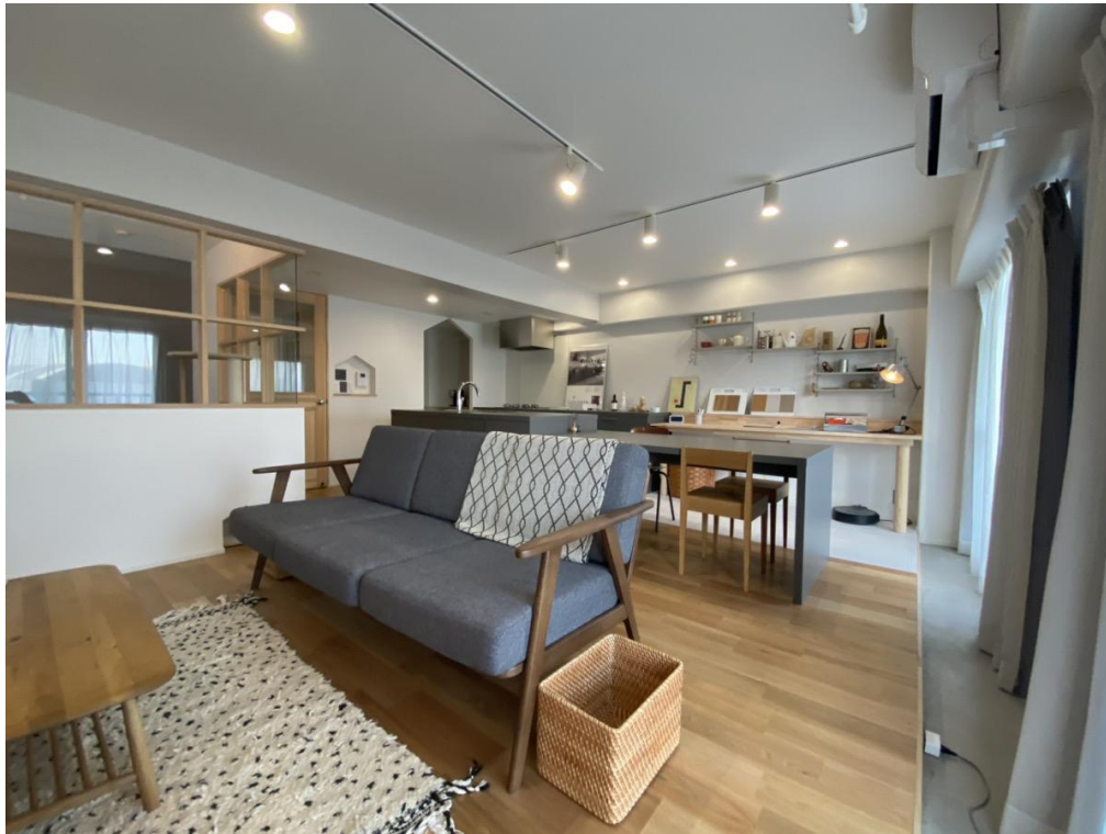
「リノベル。大阪 天満ショールーム」で再現されたsugata※の「Fika(フィカ)」テイスト。画像はイメージです。

JR大阪環状線「天満」駅徒歩6分、大人な北欧テイストの62㎡のショールームは、DINKSやファミリーを想定した可変性のある1LDK。「梅田」駅へのアクセスもよい、JR大阪環状線「天満」駅徒歩6分の好立地です。資産価値の落ちにくい立地や物件を選ぶことで、将来の売却や賃貸という選択肢も視野に入れた住まいに。将来子どもが生まれることも想定し、家事が楽になる工夫を随所に施しました。家族と自分を大切に、毎日を楽しく過ごしたい家族のための空間です。