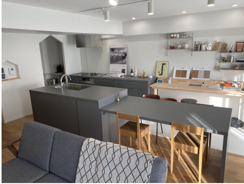
キッチンとダイニングのイメージ

週末は友達を招いてホームパーティーを楽しみたい家族のために、作業分担がしやすいセパレートキッチンを選びました。キッチンは2人でも広々作業できる幅を持たせ、家事効率もアップ。家電も格納できるパントリーがあるので、LDKがすっきりと見せられます。シンクとつながるようにダイニングテーブルを設置でき、キッチンを囲むように自然と人があつまる設計に。また、洗面台は廊下に設けることで、帰宅後スムーズに手を洗うことができ、さらに浴室を広く取れるという工夫も。洗面台が脱衣所と切り離されていることで、家を訪れた方が気兼ねなく利用できるのも来客の多い家族にとって嬉しいポイントです。