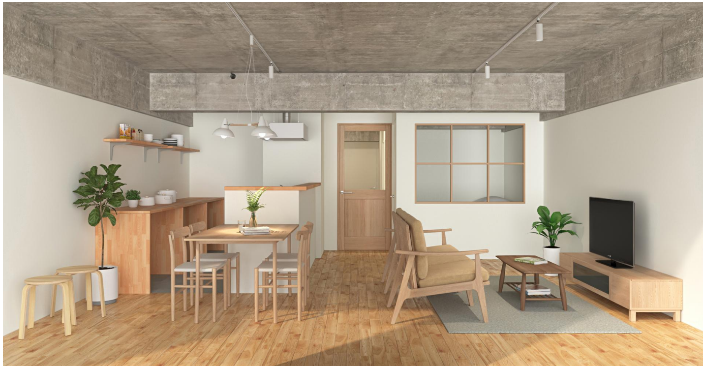
「リノベル。愛知 高岳ショールーム」で再現されたsugata※の「Canvas(キャンパス)」テイスト

名古屋市営地下鉄桜通線「高岳」駅徒歩7分、シンプルな白基調の雰囲気が魅力の74㎡のショールームは、DINKSや共働きファミリーを想定した可変性のある1LDKです。名古屋市営地下鉄東山線「栄」駅からも徒歩12分と、資産価値の落ちにくい立地や物件を選ぶことで、将来の売却や賃貸という選択肢も視野に入れた住まいです。将来子どもが生まれることも想定し、家族のライフスタイルに合わせて自由にカスタム出来るよう余白を残しました。自分らしさも楽しみつつ、快適な暮らしを実現させたい家族のために、収納や生活動線など、様々な工夫を施しました。