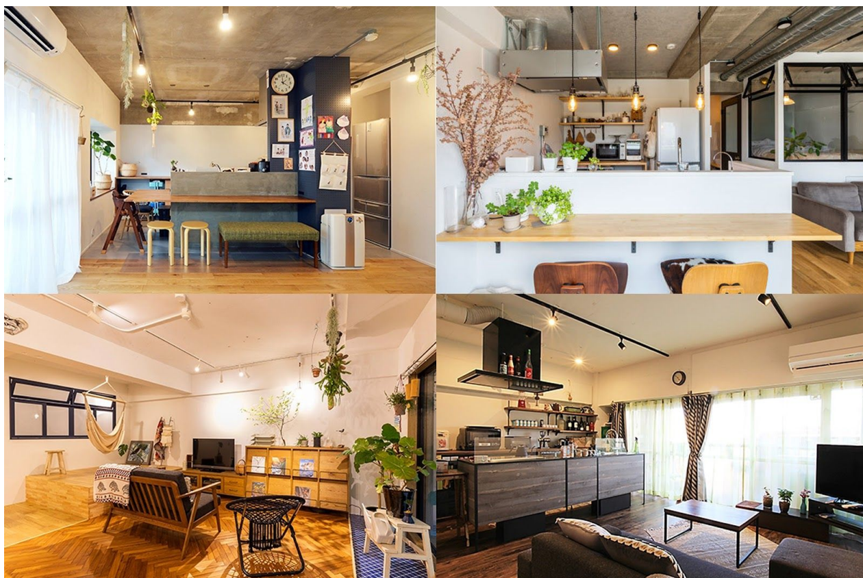
ランキング上位4つの施工事例

なお、本発表は、2019年に同サイトに公開されたリノベーション事例の中から、ユーザーの閲覧数をもとに上位10事例をランキングにしたものです。